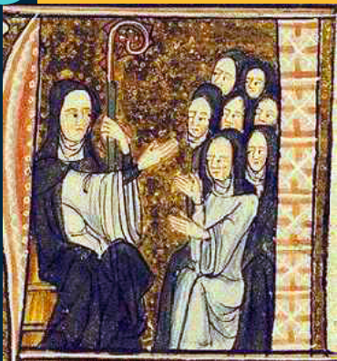
Santa Hildegarda y su comunidad de monjas en una miniatura del siglo XIII.

El catecismo 1778 nos dice que "La conciencia moral es un juicio de la razón por el que la persona humana reconoce la cualidad moral de un acto concreto que piensa hacer, está haciendo o ha hecho. En todo lo que dice y hace, [la persona] está obligada a seguir fielmente lo que sabe que es justo y recto. Mediante el dictamen de su conciencia [toda persona] percibe y reconoce las prescripciones de la ley divina."